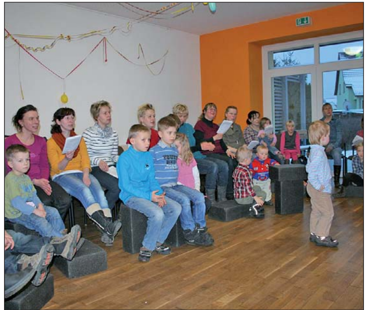
Einblick in den Kreis