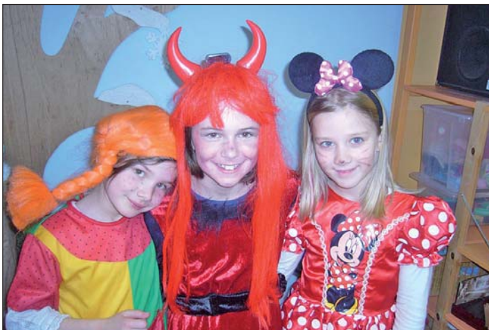
Hortkinder am Faschingsdienstag im Kinderland