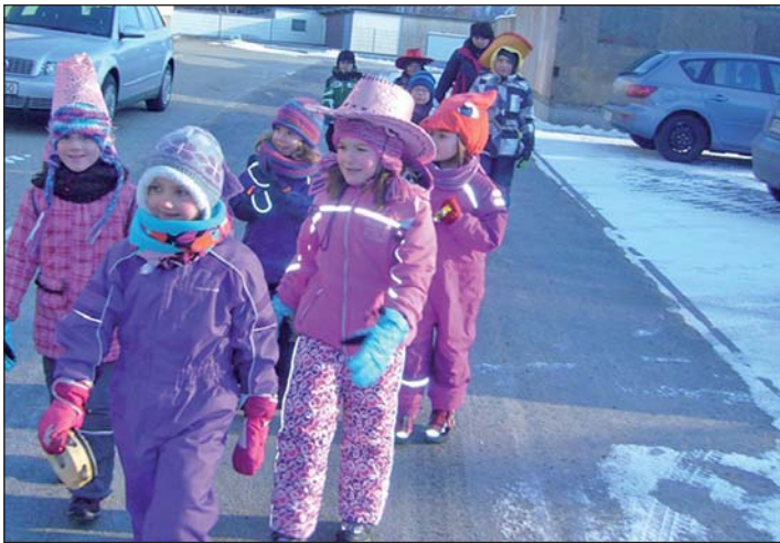
Beim Zampern am Rosenmontag

Die Kinder und Erzieherinnen vom Thiendorfer Kneipp-Kinderland.