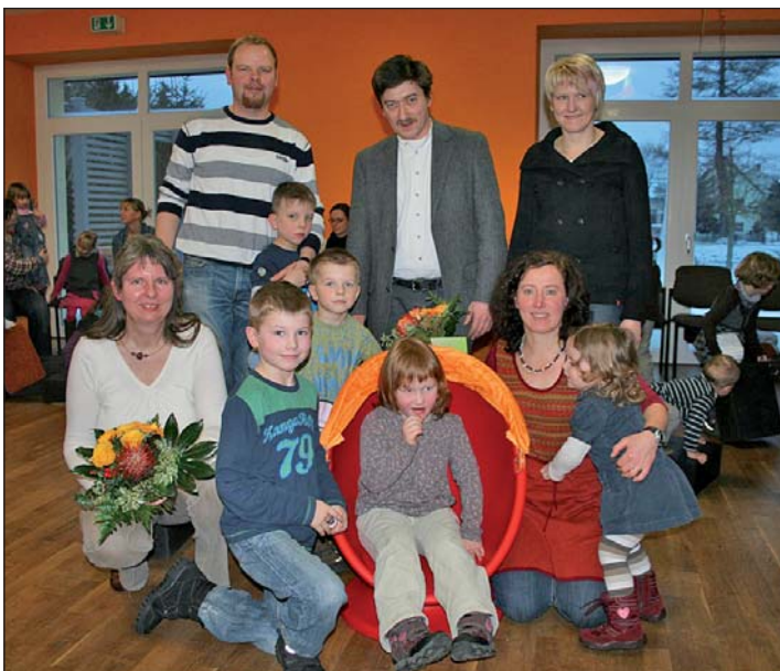
De Kirchenvorstand mit den Geschenken